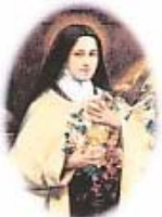
Santa Teresita del Niño Jesús, "Mi vocación es el Amor"