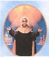
San Rafael Kalinowski