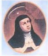
Santa Teresa de Jesús, Espíritu de fuego