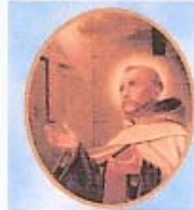
San Juan de la Cruz, Espíritu de llama.