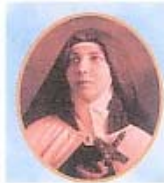
Santa Teresa de los Andes, "Vivo sólo para Dios"